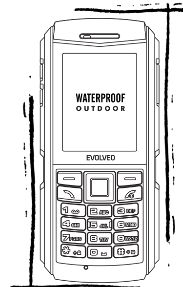
EVOLVEO StrongPhone X1