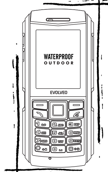
EVOLVEO StrongPhone X1